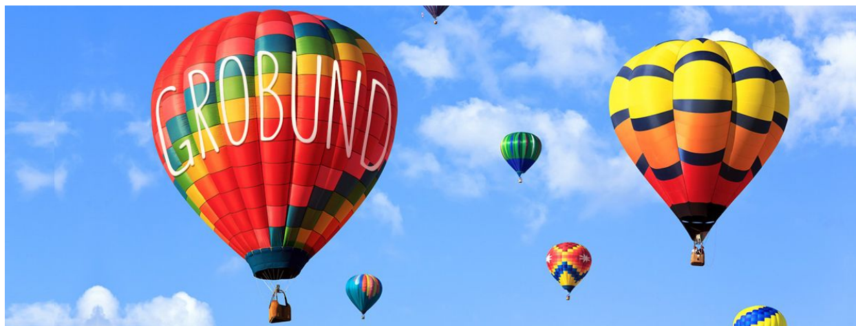
Foto: Brug fantasien og spred budskabet om Grobund på din helt egen måde