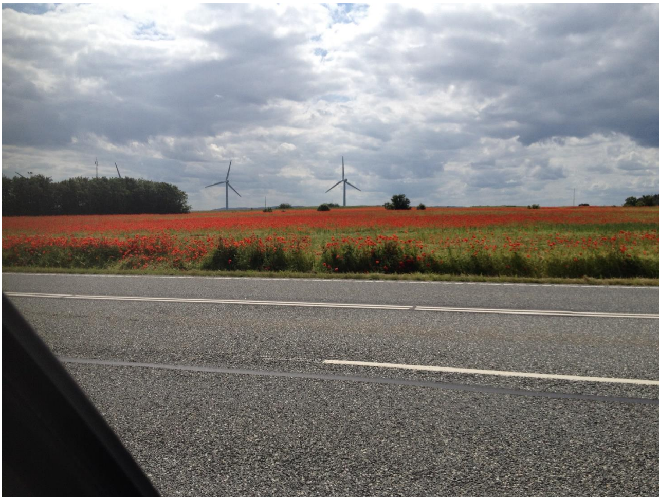
Foto af jorden, vi vil købe ved fabrikken, som der ser ud nu.

Budfristen på kommunens jord omkring fabrikken udløb kl. 12 tirsdag 4. juni.